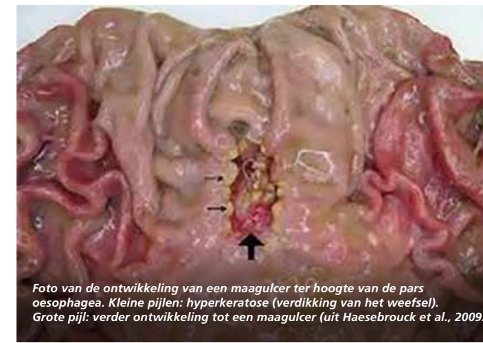
Foto van de ontwikkeling van een maagulcer ter hoogte van de pars oesophagea. Kleine pijlen: hyperkeratose (verdikking van het weefsel). Grote pijl: verder ontwikkeling tot een maagulcer (uit Haesebrouck et al., 2009).

zwakke biggen aanwezig in dezelfde koppel. Tot op heden worden maagletsels onderschat vanwege hun subklinische karakter. Zelfs milde letsels veroorzaken productieverlies en dierwelzijnsproblemen.